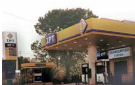
محطة الزعرورية - الزعرورية