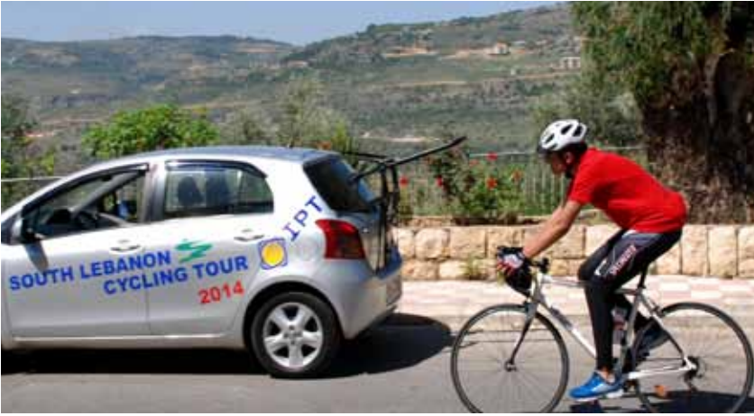
South Lebanon Cycling Tour 2014

أدرجت أي بي تي على جدول أعمالها للعام ٢٠١٤ برنامجاً لدعم النشاطات التي تندرج ضمن إطار تعزيز ثقافة المجتمع الرياضية والبيئية: «South Lebanon Cycling Tour 2014»: جرى في ٢٦ و ٢٧ نيسان بهدف تثقيف الناس بيئياً من خلال حثهم على استبدال استخدام السيارة بركوب الدراجة للحفاظ على نمط حياة صحي. – رالي بيبر «سباق الكلمة الحرة» لإحراز «كأس المصور سمير كساب»: نظّمه نادي الصحافة في ٤ أيار بمناسبة اليوم العالمي لحرية الصحافة. – رالي بيبر «ESIB 26 th Rally Paper»: نظّمته كلية الهندسة في جامعة القديس يوسف في ١٠ و ١١ أيار، وهو يعتبر الأطول مسافةً والأكثر صعوبة على نطاق لبنان، ويختبر الثقافة العامة للتلاميذ المشتركين بالإضافة إلى مهاراتهم في المنطق. – رالي بيبر «Les Scouts Des Apotres»: جرى في ١٨ أيار بهدف تسليط الضوء على ثقافة ال«Car Pooling» الذي يخفف نسبة تلوث الهواء، إضافةً إلى ترفيه الطلاب وحثهم على الإفادة أكثر من أجواء العطلة الأسبوعية.