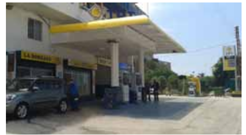
محطة La Boreale - المنصف