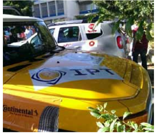
ESIB 26 th Rally Paper