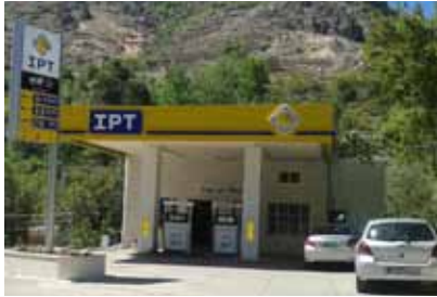
محطة كميل حرب - تنورين

إنضمت مجددًا إلى شبكة أي بي تي محطات جديدة في مناطق مختلفة، كما رمت محطات عديدة توحيداً لعلامة أي بي تي التجارية ورفع مستوى خدماتها.